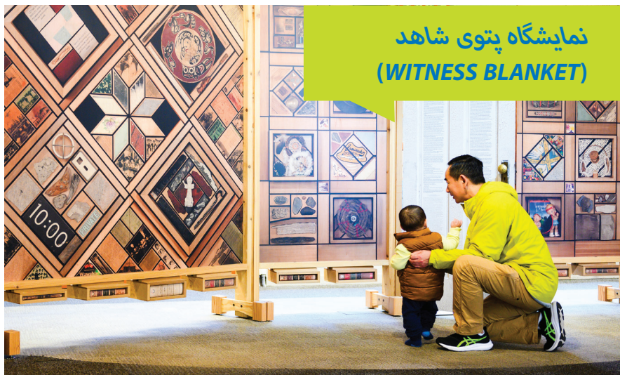
نمایشگاه پتوی شاهد (WITNESS BLANKET)

به لطف حمایت بنیاد کتابخانه و نیکوکارانی مانند شما، ما فضای برای اندیشیدن، التیام، و گفتگو ایجاد کردیم. ما با همکاری مرکز سالمندان قوم اسکوامیش و مدرسه‌ی کوچولوهای کاپیلانو ( Xwemélch'stn Etsimxawtxw )، بازدیدهای خصوصی را در دسترس ۴۵ سالمند و ۱۰ کودک قرار دادیم، که فضای امن جهت برقراری ارتباط با این داستانهای قوی برای آنها فراهم گردید.