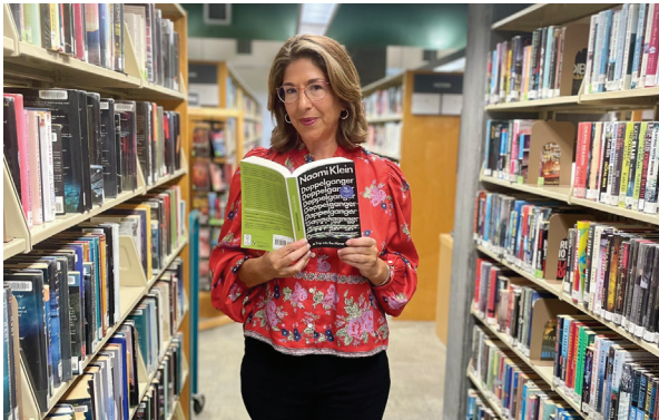
نائومی کلین، نویسنده ی مشهور، در سپتامبر گذشته با خواندن بخش هایی از آخرین کتابش حاضران را مجذوب کرد.