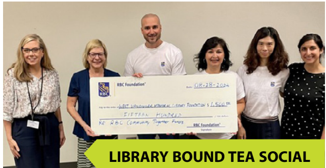
LIBRARY BOUND TEA SOCIAL

اولین کاربران این استودیو دانش آموزان مدرسه Xwemelch'stn (مدرسه کوچولوهای کاپیلانو) بودند تا نام Skwxwú7mesh sníchim گیاهان بومی موجود در باغ نمایشی کتابخانه، Swáyi Temíxw را ضبط کنند. پس از آن بیش از ۱۰۰ نفر از این استودیو استفاده کردند.